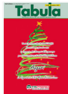
PERIODICO DELLA FNP CISL MONZA BRIANZA LECCO

Infine, largo all'imprenditoria femminile con un evento di alto livello davvero da non perdere: durante la Mostra Artigianato, se mai ce ne fosse bisogno, avremo la conferma che le donne imprenditrici non solo sono una realtà viva e attiva nel nostro territorio, ma un mondo capace di sfidare - e vincere - l'universo maschile anche nei lavori più duri e faticosi. Ciliagina sulla torta la partecipazione di Beatrice Venezi, la più giovane direttore d'orchestra in Europa. Anche i giovani saranno al centro di diverse iniziative con lo scopo di far incontrare gli artigiani di oggi con quelli di domani. Insomma, una 46ª edizione della Mostra Artigianato ricca di eventi, novità, dibattiti, laboratori e sorprese a cui è impossibile mancare. Vi aspettiamo numerosi!