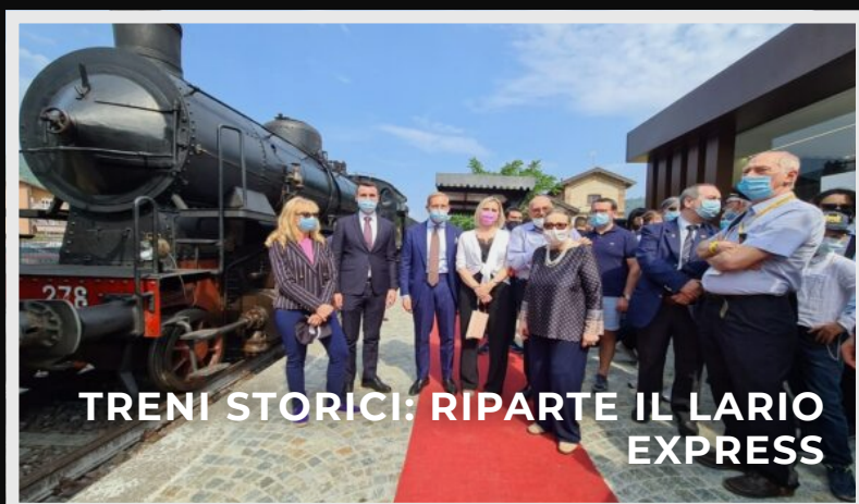
TRENI STORICI: RIPAETE IL LARIO EXPRESS