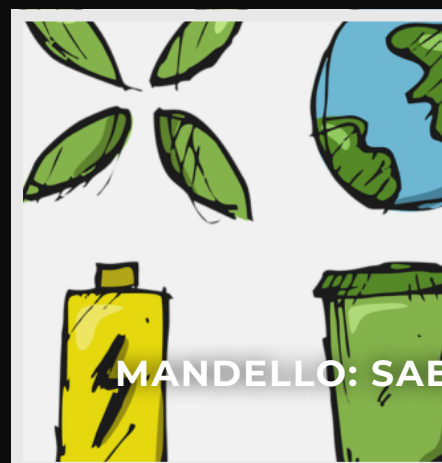
MANDELLO: SABATO GIC